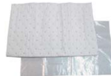
油吸着シート×2 後処理ポリ袋×1