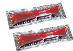
天ぷら火災消火パック×2