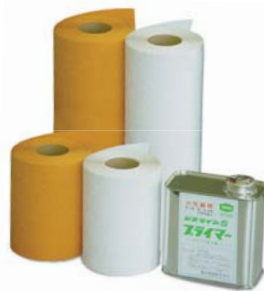
KP-34 (1L缶) ●ジスラインプライマー ※4ℓ缶・18ℓ缶もあります。