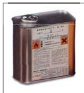
M-33 (1L缶) ●キクラインプライマー ※3ℓ缶もあります。